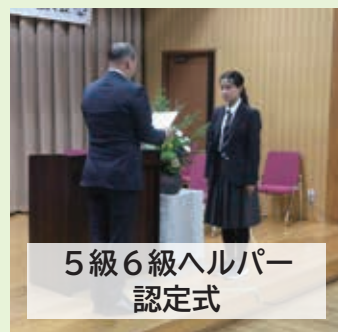
5級6級ヘルパー 認定式

12月14日（土）、富有まんてんホールで「令和6年度南部町社会福祉推進大会」を開催し、70名以上の方々にご参加いただきました。