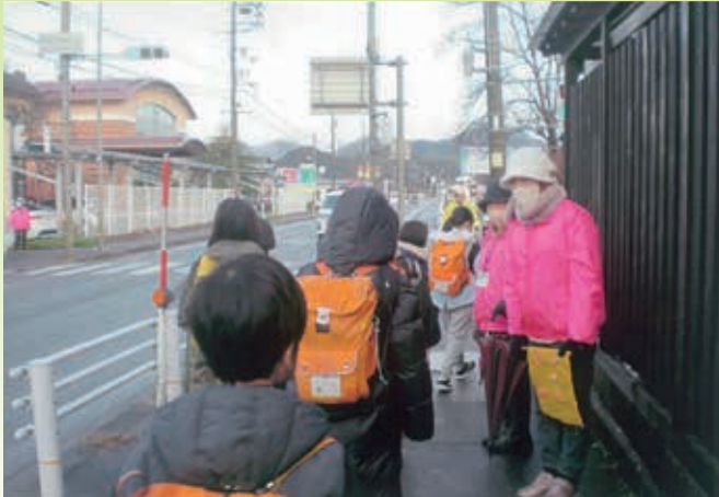
▲ 月に一回小学校にて行っています