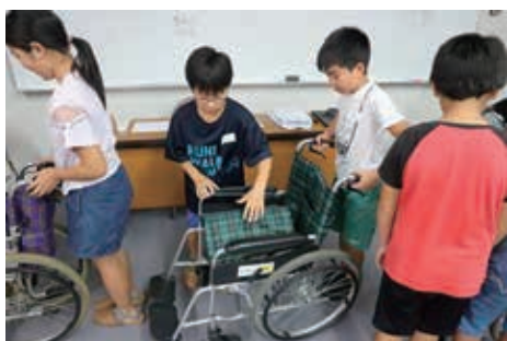
夏休みボランティア体験事業 （南部町社会福祉協議会）