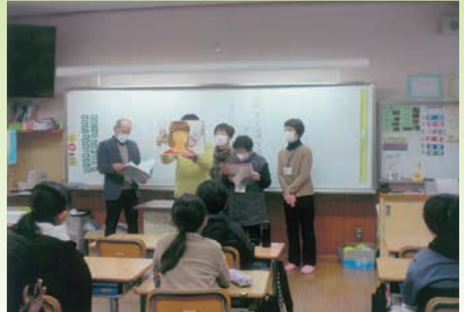
▲ 薬物乱用防止の紙芝居の読み聞かせを小学6年生を対象に行ないました