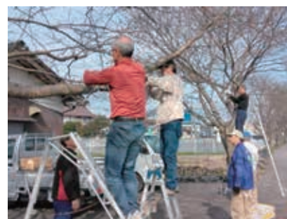
平和のさくら並木 維持管理事業 （手間さくら会）