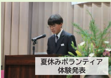
夏休みボランティア 体験発表