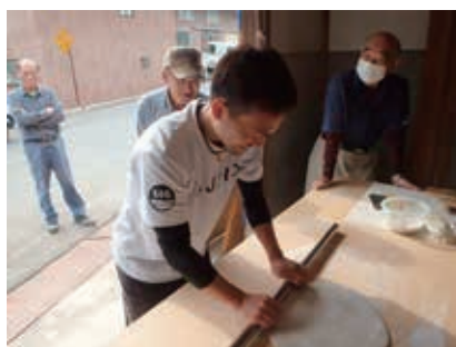
世代間交流事業 （御内谷区）